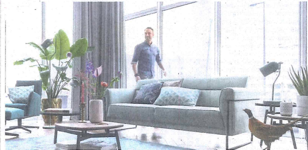
Design wird bezahlbar mit den modernen Wohnwelten von XOOON – und lässt sich mit ansprechend Wohnaccessoires von COCO MAISON wunderbar unterstreichen.